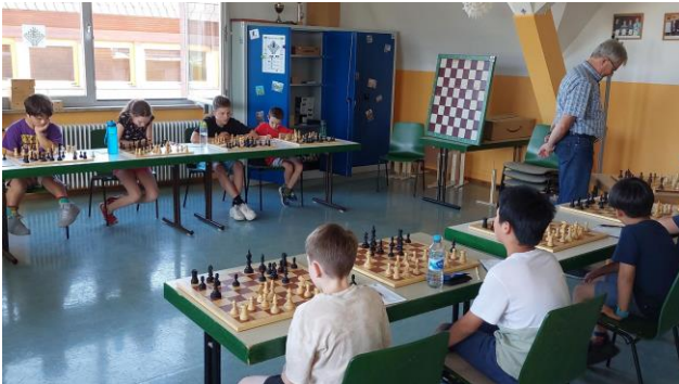
Blick in den Turniersaal

Hier ein paar optische Eindrücke von dem epischen Duell: