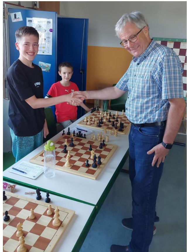
... und muss kurz darauf die Waffen strecken!