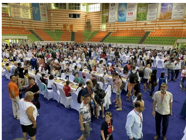
Bild: Blick in den gigantischen Turniersaal

In Runde 7 verlor Ailin zwar ihre Partie, konnte dann aber die beiden folgenden Begegnungen gegen besser Platzierte für sich entscheiden und lag nach 9 Runden mit 5,5 Punkten sensationell auf Platz 20.