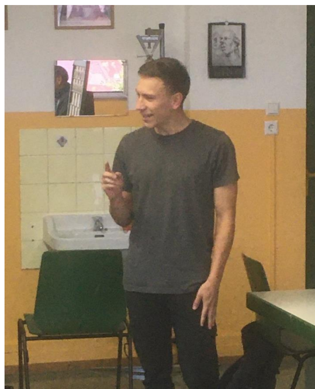
Bilder: Alexander in Aktion