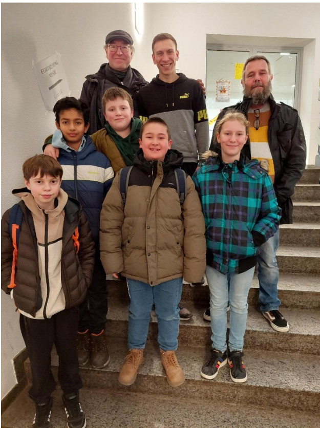
Das ganze Team - Finde die Betreuer!