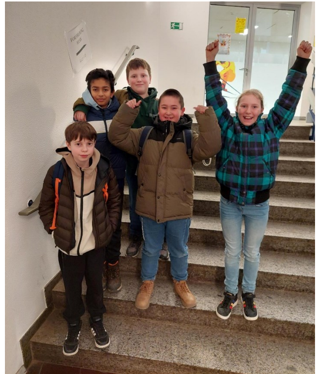
So sehen Sieger aus! Die „Glorreichen Fünf“ strahlen um die Wette