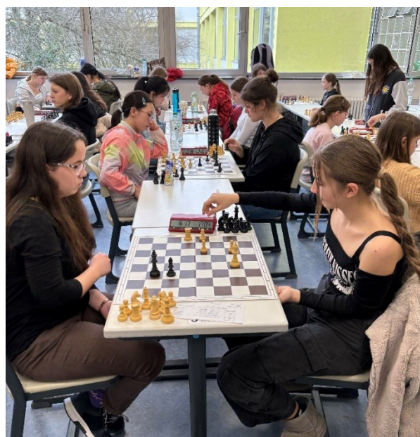
Rechts: FEG-Mädels / links: die Rivalinnen aus KA

So ging es mit viel Rückenwind ins Spitzenspiel gegen den Meister aus 2024: