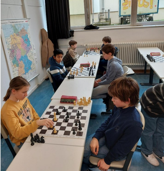
Ronja in Aktion

Das Trainerteam war mit der Leistung der Kids aber hoch zufrieden und stolz auf das Geleistete. Gleich im Ersten Jahr der Schach AG so ein Erfolg. Respekt! Hier noch ein paar Schnappschüsse aus Ettlingen: