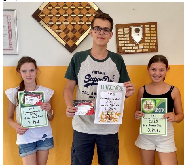
Die Medaillengewinner der Jugendmeisterschaft

Ein großes Lob geht an alle Teilnehmer: Die Konzentration war stets sehr hoch, viele Partien verliefen sehr knapp und es wurde sehr gutes Schach gespielt.